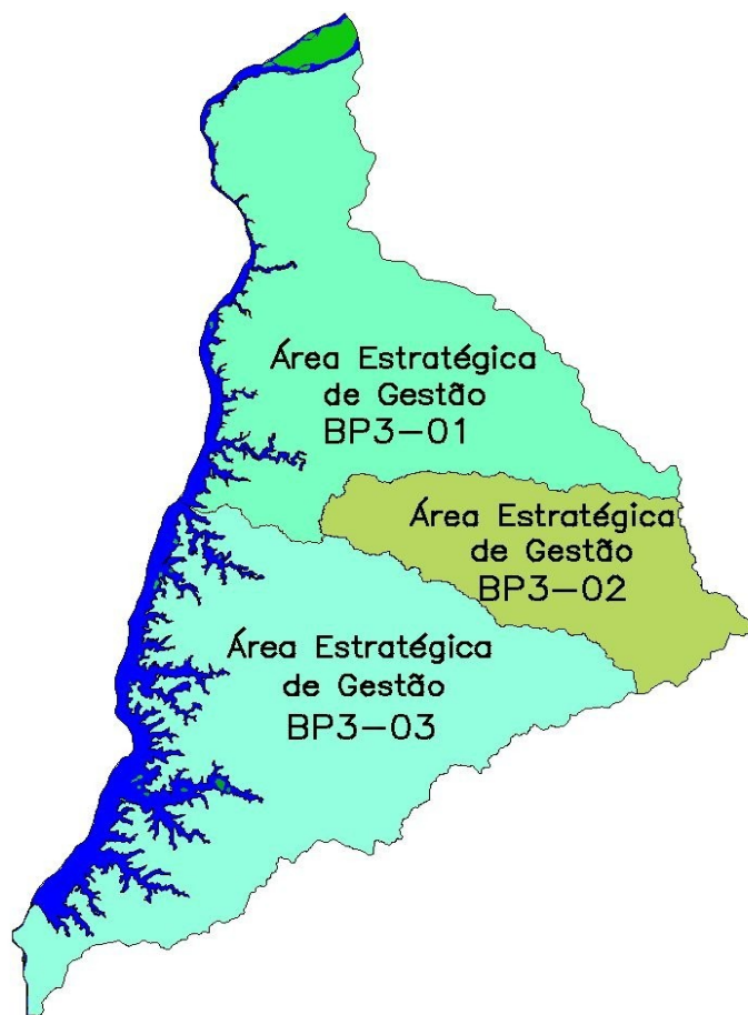
Figura 03: Localização das Áreas Estratégicas de Gestão na Bacia do Paraná 3.